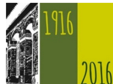
Escola Els Til·lers Artesa de Lleida